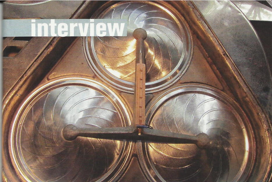
...en een National Tricone uit 1929