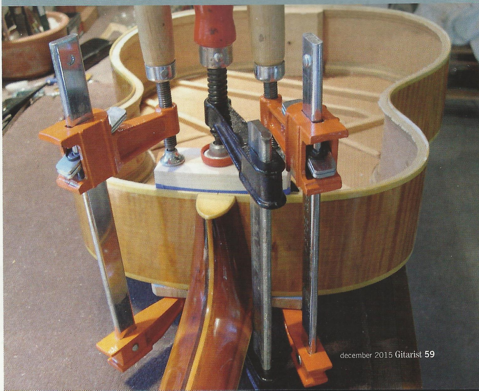
Reparatie van een 1952 Epiphone...

Na afloop van de masterclass vroegen we Flip Scipio waar hij momenteel aan